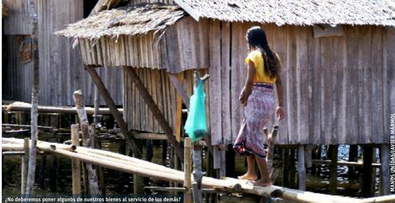
MANOS UNIDAS/JAVIER MÁRMOL

¿No deberemos poner algunos de nuestros bienes al servicio de los demás?