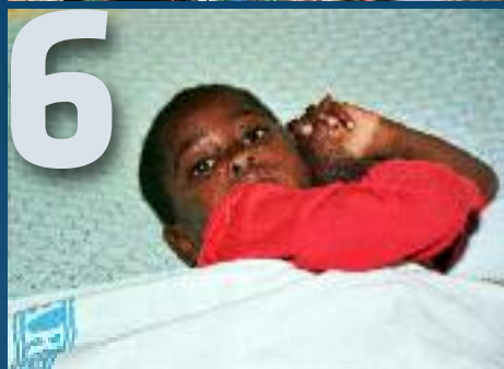
MANOS UNIDAS / JAVIER MÁRMOL