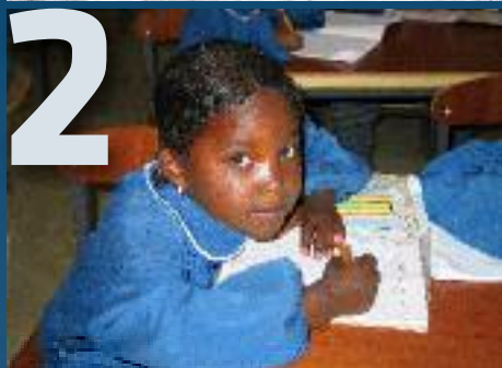
MANOS UNIDAS/MARTA CARREÑO