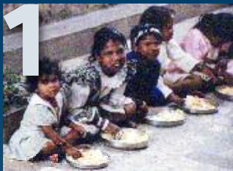
MANOS UNIDAS/JAVIER MÁRMOL