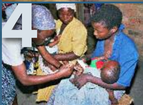
MANOS UNIDAS/JAVIER MÁRMOL