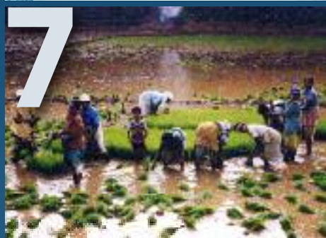
MANOS UNIDAS / JAVIER MÁRMOL