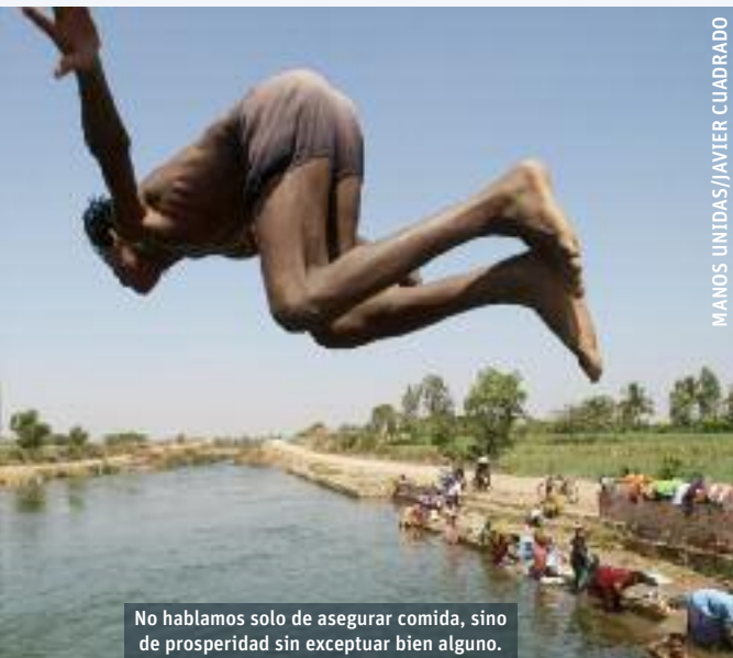
MANOS UNIDAS/JAVIER CUADRADO

No hablamos solo de asegurar comida, sino de prosperidad sin exceptuar bien alguno.