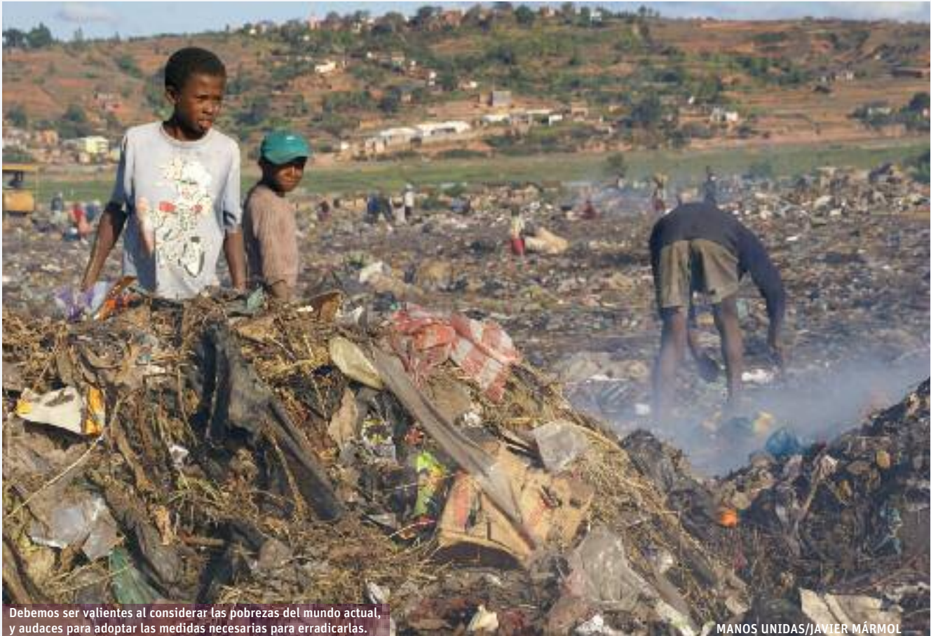
Debemos ser valientes al considerar las pobrezas del mundo actual, y audaces para adoptar las medidas necesarias para erradicarlas.